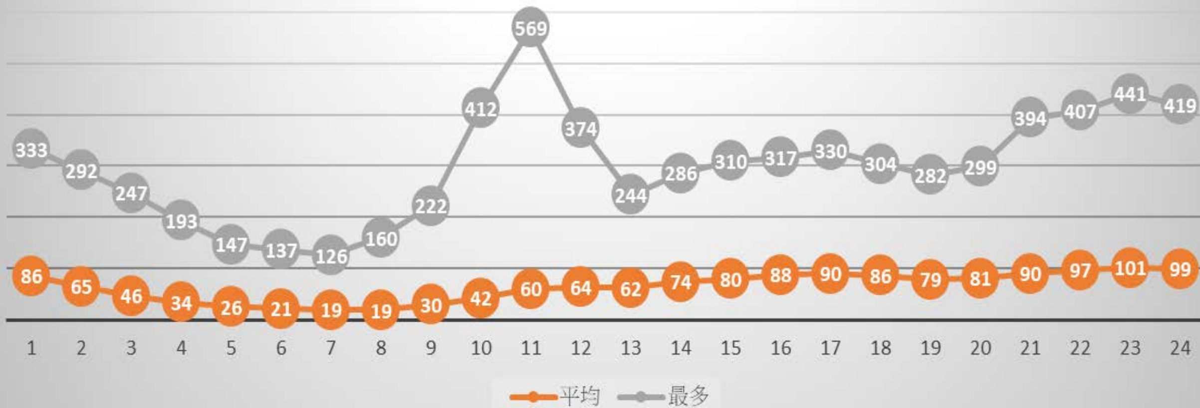
尖峰離峰使用人次統計(尖峰月份總表)