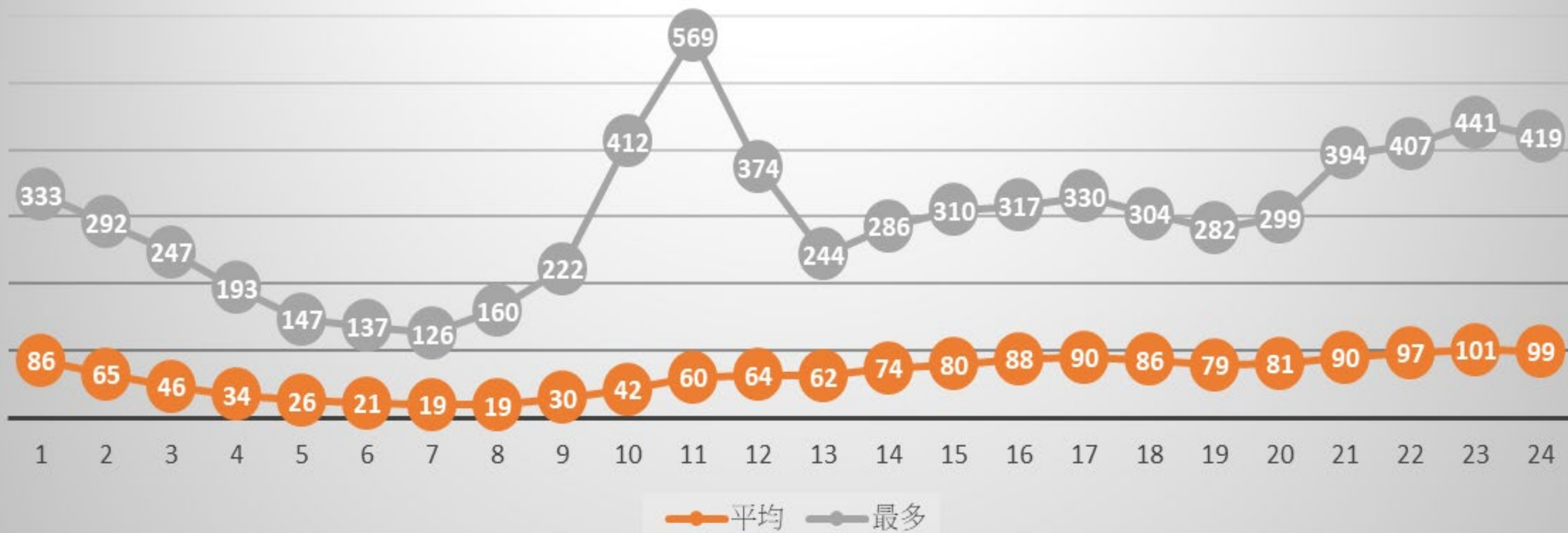
尖峰離峰使用人次統計(尖峰月份總表)